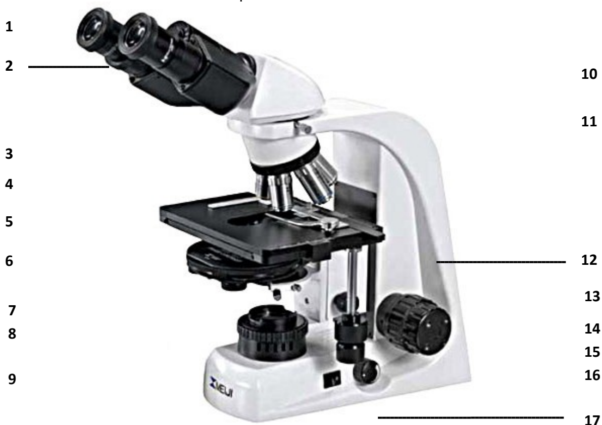
Рис. Микроскоп биологический (MeijiTechno TM 4200L (Япония))