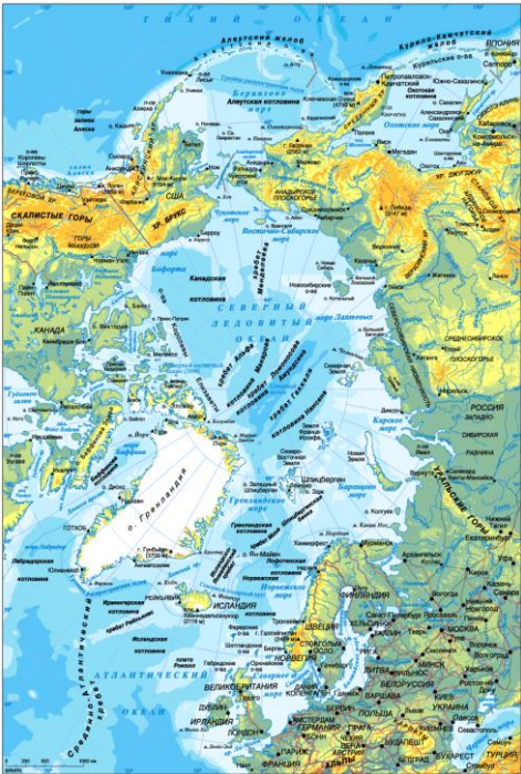
Рис. 1 – Современная физическая карта Арктики

Нумерация рисунков сквозная по всей работе. Например: Рис. 2 (второй рисунок). Пример оформления рисунка: