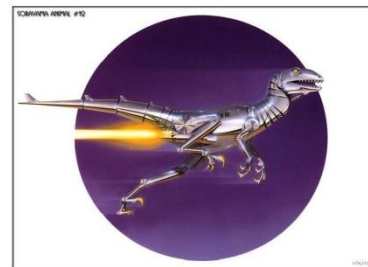
Рис. 2. Правый