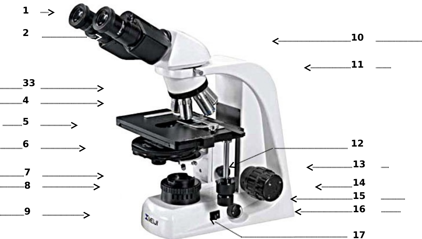
Рис. Микроскоп биологический (MeijiTechno TM 4200L (Япония))