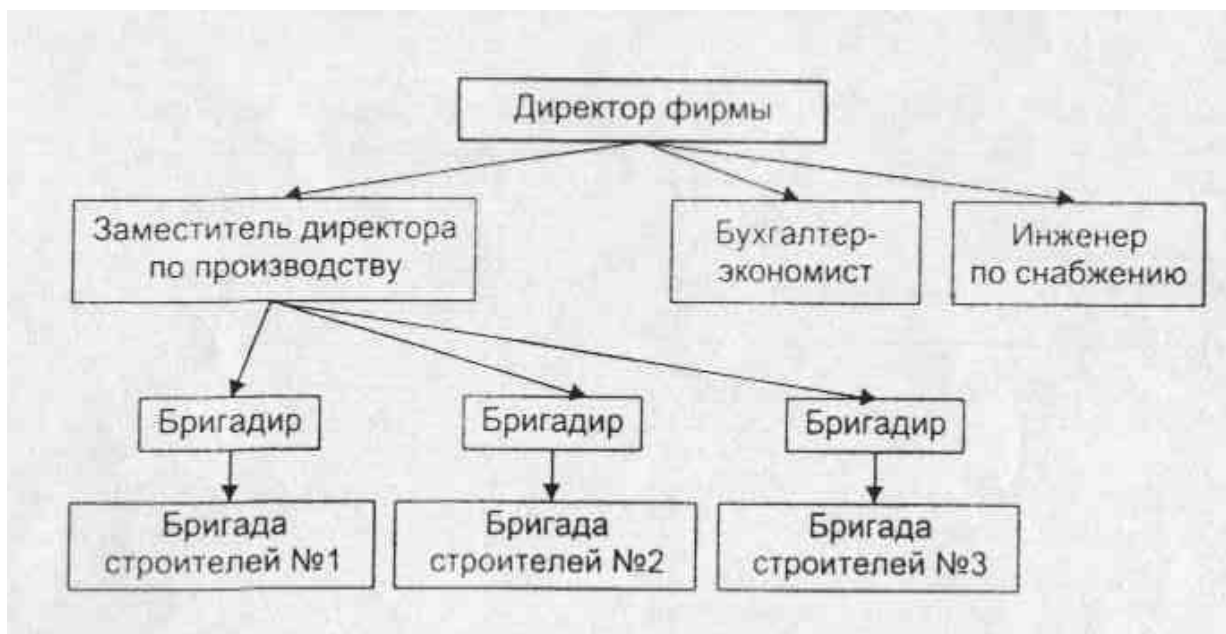
Рис. 1. Структура управления малой фирмой «Строитель»

По приведенным структурам управления предприятиями установите, к какому типу структур они относятся. Дайте развернутое обоснование.