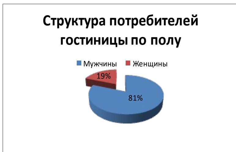
Рисунок 1 – Структура потребителей гостиницы «Красное Сормово» по полу

Задание 1. В результате проведения исследования потребительских предпочтений гостиницы «Красное Сормово» были получены следующие данные.