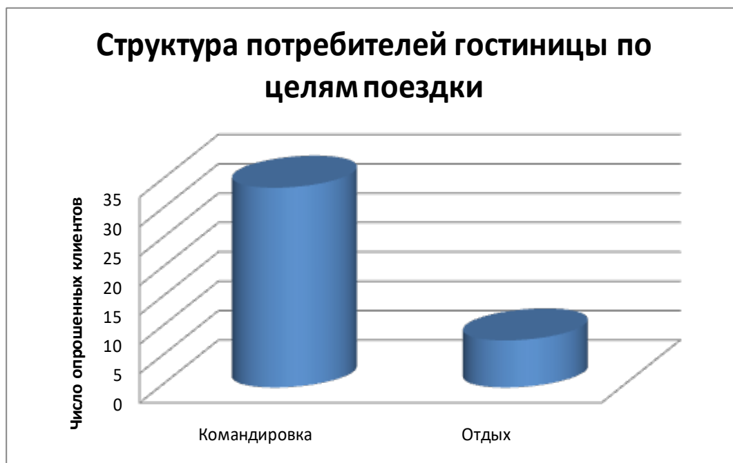
Рисунок 2 – Структура потребителей гостиницы «Красное Сормово» по целям поездки