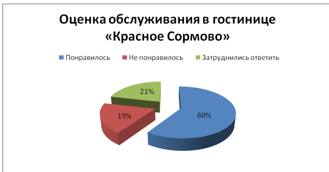
Рисунок 3 – Оценка обслуживания в гостинице «Красное Сормово»