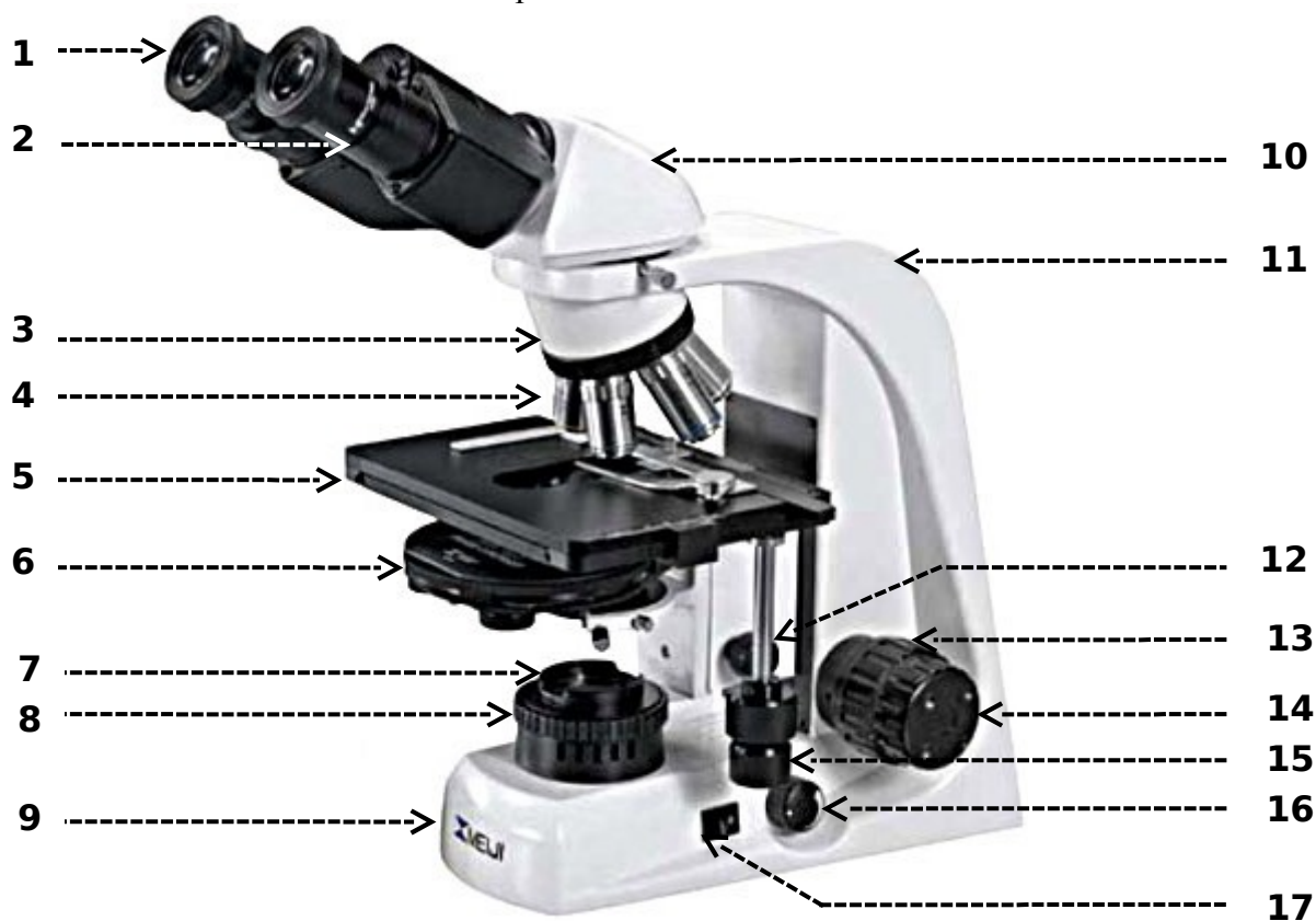
Рис. Микроскоп биологический (MeijiTechno TM 4200L (Япония))