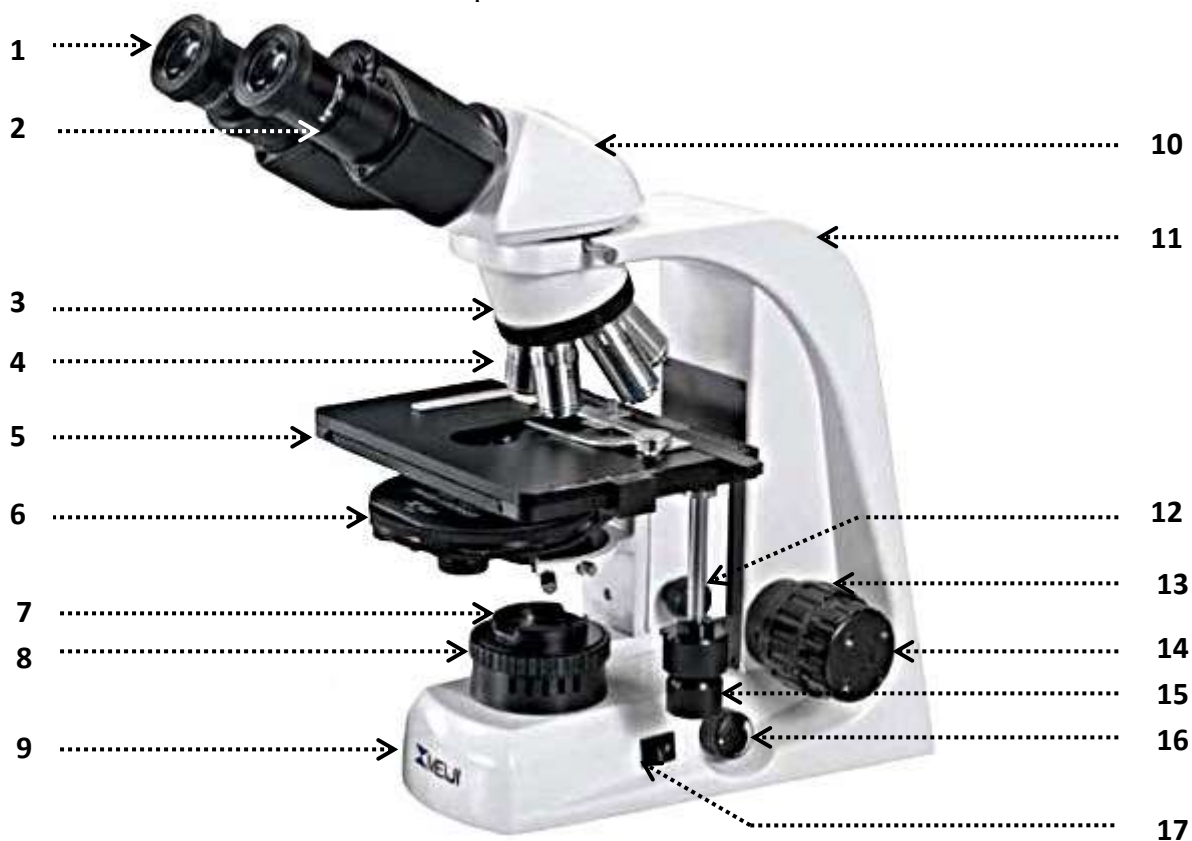
Рис. Микроскоп биологический (MeijiTechno TM 4200L (Япония))