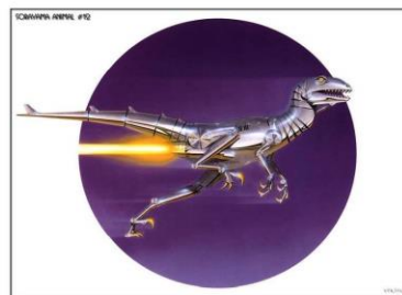
Рис. 2. Правый