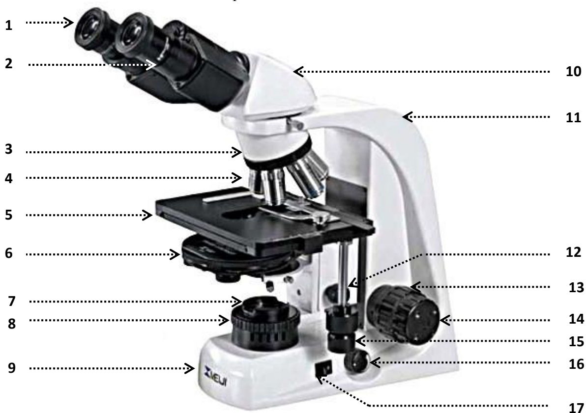
Рис. Микроскоп биологический (MeijiTechno TM 4200L (Япония))